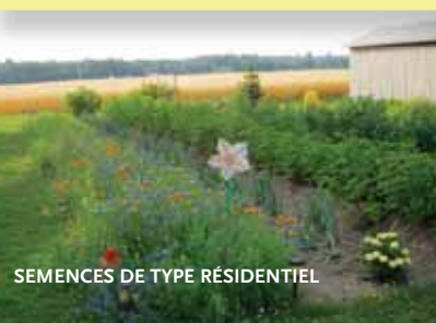
SEMENCES DE TYPE RÉSIDENTIEL