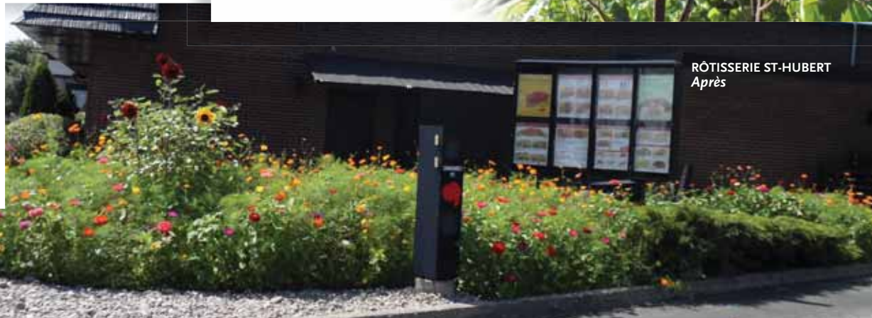
RÔTISSERIE ST-HUBERT Après